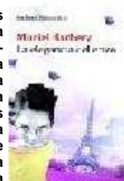
La Elegancia del Erizo de Barbery Murriel Editoria Seix Burriel, S.A.

Un pequeño tesoro que nos revela cómo alcanzar la felicidad gracias a la amistad, el amor y el arte. La autora, revelación literaria en Francia, no solo muestra a través de dos personajes solitarios que en apariencia sólo tienen en común que viven en el número 7 de la calle Grenelle de París: una joven de doce años y la portera del inmueble. Entre las dos inventarán un mundo mejor.