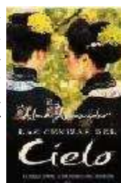
Las Cenizas del Cielo

En tiempos de la Gran Revolución China un joven campesino está marcado por una profecía que le llevará a convertirse en el líder del levantamiento. Amais, educada en las costumbres y tradiciones antiguas chinas, verá como su vida queda partida entre su familia y el amor al hombre que quiere destruir aquello en: que cree